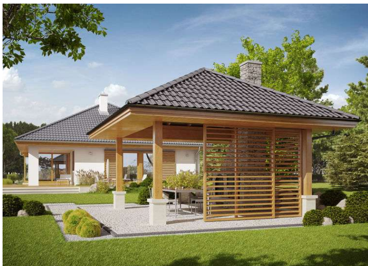
1. Pomieszczenie - 18.97m2