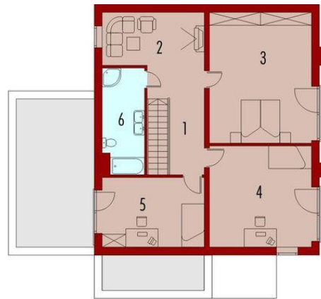
Rzut piętra I: