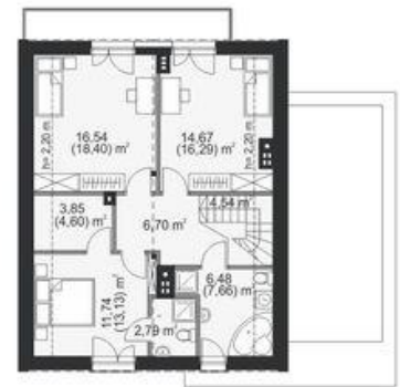
PODDASZE pow. użytkowa: 67,31 m 2 pow. podłogi: 74,11 m 2