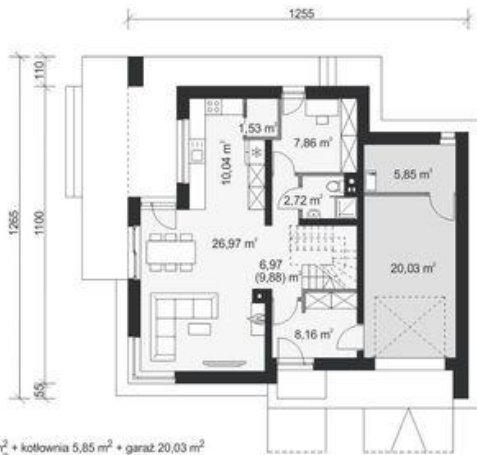
PARTER pow. użytkowa: 64,25 m 2 + kotłownia 5,85 m 2 + garaż 20,03 m 2 pow. podłogi: 93,04 m 2