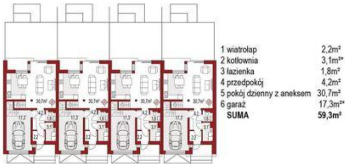
Parter ( 1 segment) 38,9m 2 + 20,4m 2 *