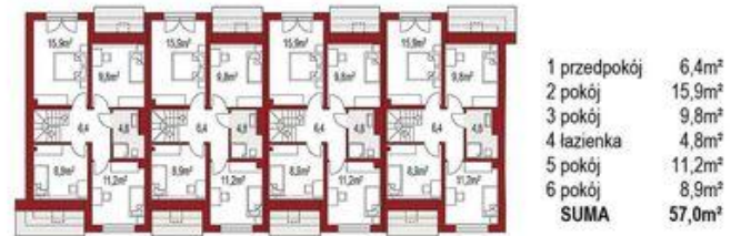
Poddasze ( 1 segment) 57,0m 2