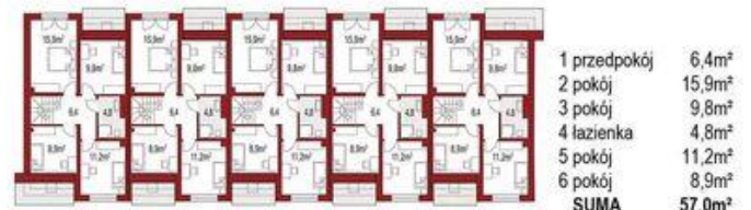
Poddasze ( 1 segment) 57,0m 2