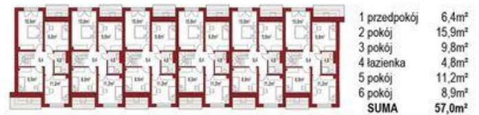
Poddasze ( 1 segment) 57,0m 2