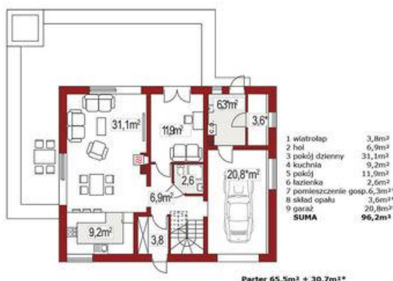
Parter 65,5m 2 + 30,7m 2 *