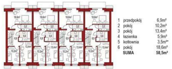
Piętro (1 segment) 55m 2 + 3,5m 2*