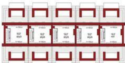
Strych 19,0m 2*