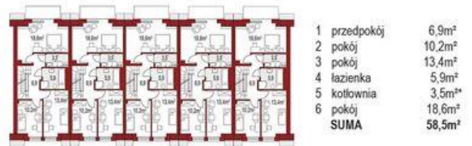
Piętro (1 segment) 55m 2 + 3,5m 2*