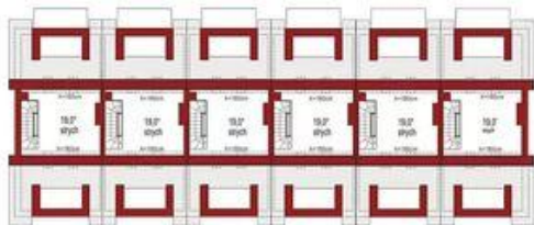
Strych 19,0m 2*