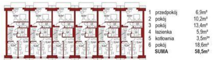
Piętro (1 segment) 55m 2 + 3,5m 2*