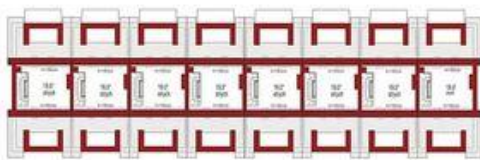
Strych (1 segment) 19,0m 2*