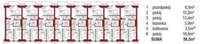
Piętro 55m 2 + 3,5m 2*