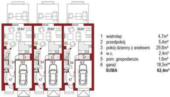
Parter (1 segment) 43,9m 2 + 18,5m 2*