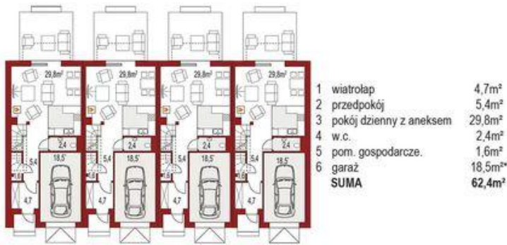
Parter (1 segment) 43,9m 2 + 18,5m 2*