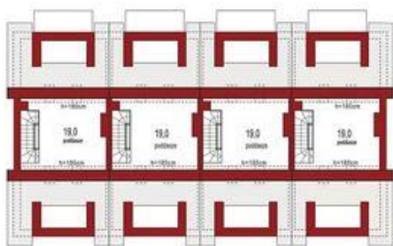
Poddasze (1 segment) 19,0m 2