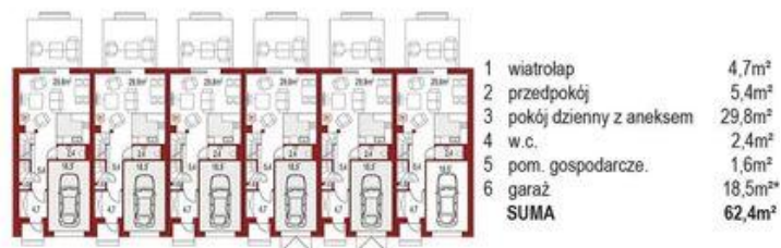
Parter (1 segment) 43,9m 2 + 18,5m 2 *