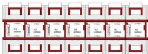
Poddasze (1 segment) 19,0m 2