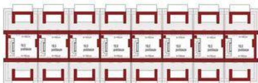
Poddasze (1 segment) 19,0m 2