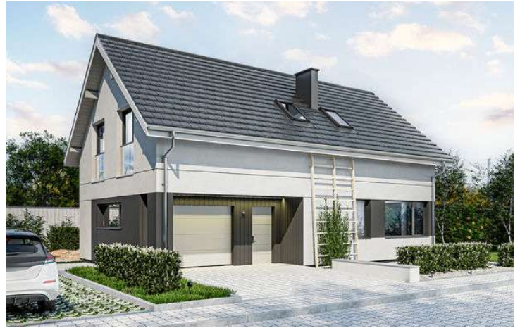
KZYT PIERWIOZI SKALA 1:100 PA-17 1. 10. 2022