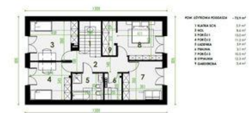
SITUACJA SKALA 1:200 PA-17 1. 10. 2022