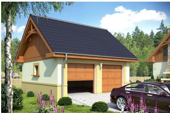
1.Garaż 38.2 m 2 ,