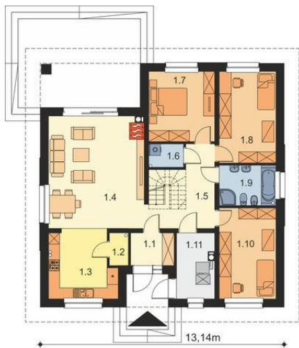
PARTER 118,63 m2