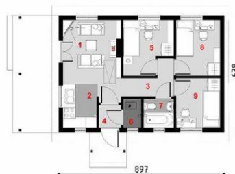
Parter 1. pokój dzienny 11.65 m 2 2. aneks kuchenny 2.80 m 2 3. korytarz 4.22 m 2 4. przedsiónek 1.51 m 2 5. sypialnia 7.29 m 2 7. łazienka 2.63 m 2 8. sypialnia 7.28 m 2 9. sypialnia 6.50 m 2 razem: 43.88 m 2 6. pom. techn. 1.56 m 2