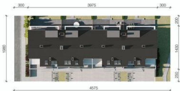
HomeKONCEPT-63 B2 zagospodarowanie terenu