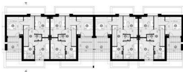
HomeKONCEPT 63 B2