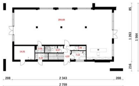
PROPOZYCJA PODSTAWOWA PIĘTRA - 1 LOKAL UŻYTKOWY