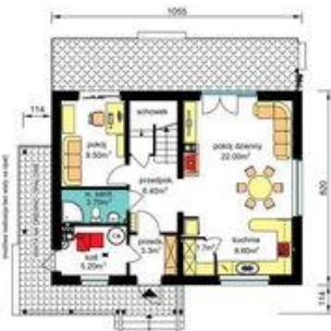
PARTER - z kotłownią na paliwo stałe Pu-55.20m 2 , Pg-5.20m 2