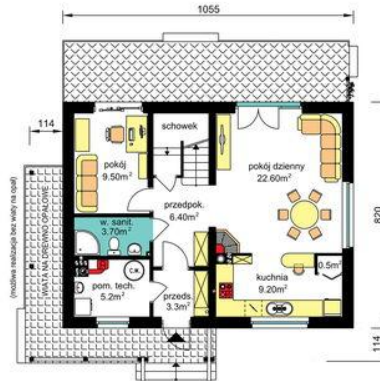
PARTER - wariant z ogrzewaniem gazowym oraz zamiennym usytuowaniem kominka (rysunki wariantowe zawarte w projekcie) Pu-55.20m 2 , Pg-5.20m 2