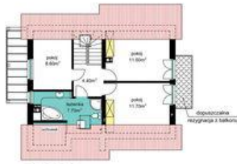
PODDASZE Pu-43.90m 2 , p.podł.-62.40m 2