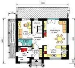
PARTER Pu-55.20m 2 , Pg-7.40m 2