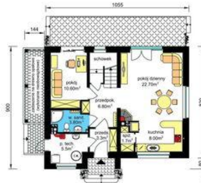
PARTER - wariant Pu-56.90m 2 , Pg-5.50m 2 - zamienne usytuowanie kominka - ogrzewanie gazowe (rysunki zawarte w projekcie)

Wariantowe rozwiązanie funkcji parteru (z przeniesionym kominkiem) może być zastosowane również w wersji z kotłownią na paliwo stałe.