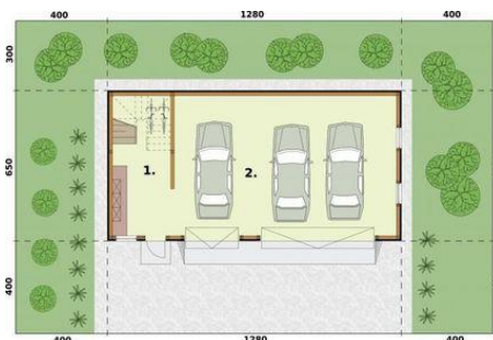
Rzut przyziemia 1 Pomieszczenie gospodarcze 15.04m 2 2 Garaż 58.13m 2