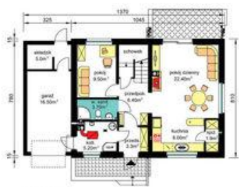
PARTER - z kotłownią na paliwo stałe Pu-55.20m 2 , Pg-26.70m 2