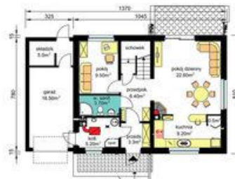
PARTER - wariant usytuowania kominka (rysunki zawarte w projekcie) Pu-55.20m 2 , Pg-26.70m 2