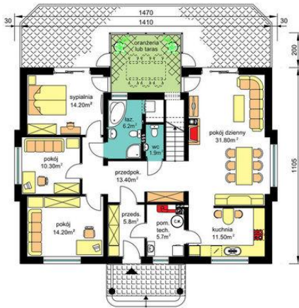
PARTER - wariant z ogrzewaniem gazowym (rysunki zawarte w projekcie) Pu-109.30m 2 , Pg-5.70m 2