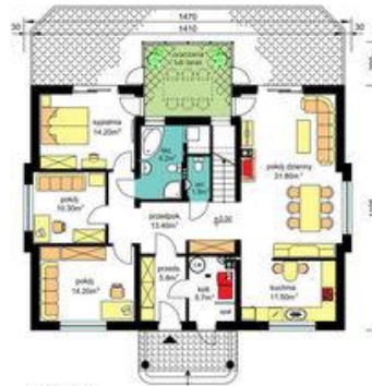
PARTER Pu-109.30m 2 , Pg-5.70m 2